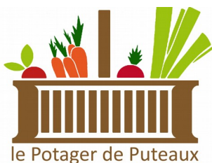
le Potager de Puteaux