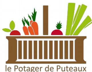
le Potager de Puteaux