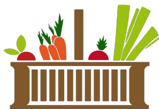
le Potager de Puteaux